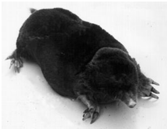
Voksen muldvarp. Størrelse ca. 15 cm.

På grund af sit sorte dæmoniske ydre og sin underjordiske levevis har den spillet en rolle for folketroen og -medicinen. Skulle man f.eks. se spøgelse ved højlys dag, var det muldvarpeblod, som skulle smøres over øjnene!